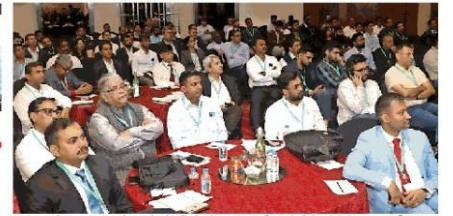
कार्यशाला में मेजबान सॉलिड वेस्ट मैनेजमेंट के क्षेत्र में काम कर रही कंपनियों के प्रतिनिधि। ● वर्चुअल

यह बात केंद्रीय मंत्री नितिन गडकरी ने कही। वे शुक्रवार को नेशनल सॉलिड वेस्ट मैनेजमेंट एसोसिएशन द्वारा आयोजित दो दिवसीय राष्ट्रीय कार्यशाला में बतौर विशेष अतिथि बोल रहे थे। उन्होंने वर्चुअली संबोधित किया। कार्यशाला का विषय बिल्डिंग द फ्यूचर ऑफ वेस्ट मैनेजमेंट एंड रीसाइकलिंग इंडिया रखा गया है। कार्यशाला में सॉलिड वेस्ट मैनेजमेंट के क्षेत्र में काम कर रही कंपनियों के प्रतिनिधि शामिल हुए हैं। गडकरी ने कहा कि सड़क निर्माण के क्षेत्र में सरकार एचएएम मॉडल लाई है। इसी तरह के मॉडल की जरूरत वेस्ट मैनेजमेंट के क्षेत्र में भी है। पीपीपी मॉडल से कचरे से पैसा पैदा होगा। वर्तमान में सड़क बनाने के लिए सड़क मंत्रालय नगर निगमों से सेगीरगेटेड वेस्ट कच्चे मटेरियल के रूप में खरीद रहा है। इस क्षेत्र में पीपीपी मॉडल आने से वेस्ट मैनेजमेंट को नई दशा और दिशा मिलेगी।